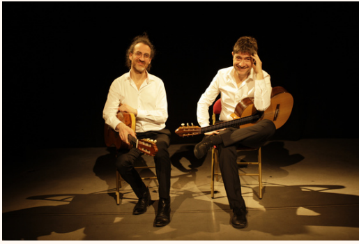
Théâtre la Grange, Luynes, avril 2023