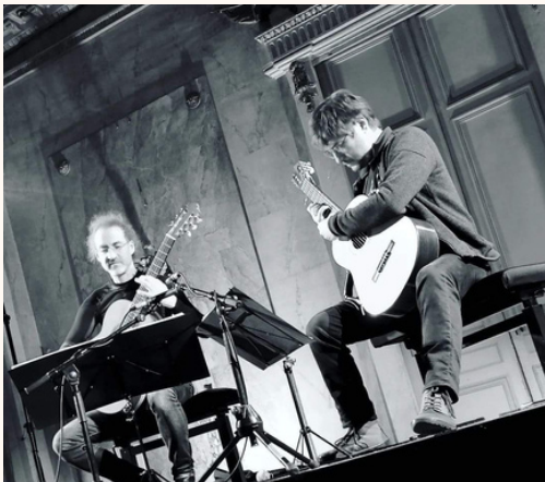
Palais des Ducs, Dijon, Janvier 2023