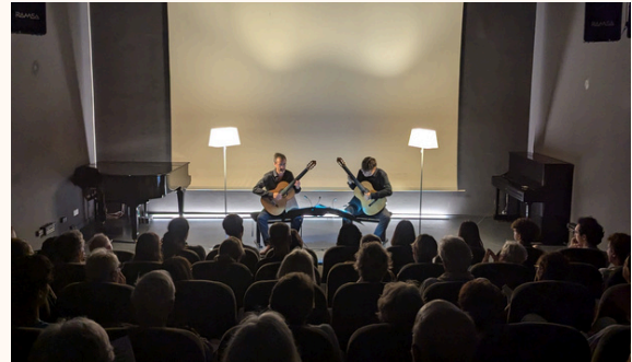
"Nice Classic Festival", Nice, août 2024