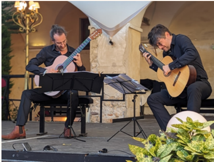
"Nice Classic Festival", Nice, août 2023