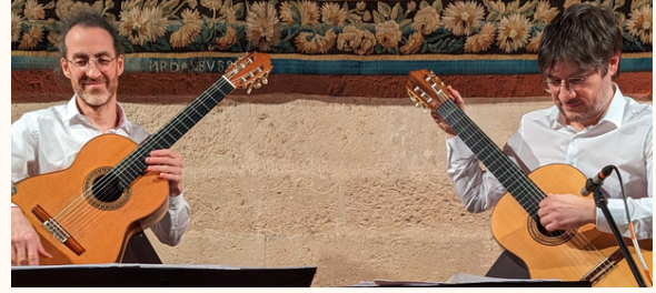
Palais des archevêques, Narbonne, février 2023